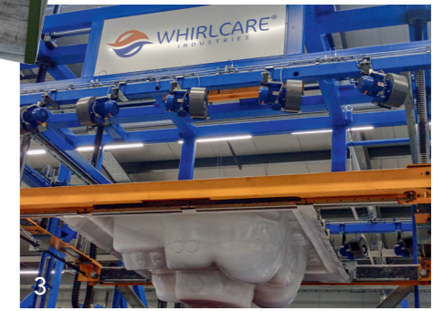
3+4 Beim Tiefziehen, der Verstärkung und der Weiterbearbeitung der Wannen kommt modernste Technik zum Einsatz.