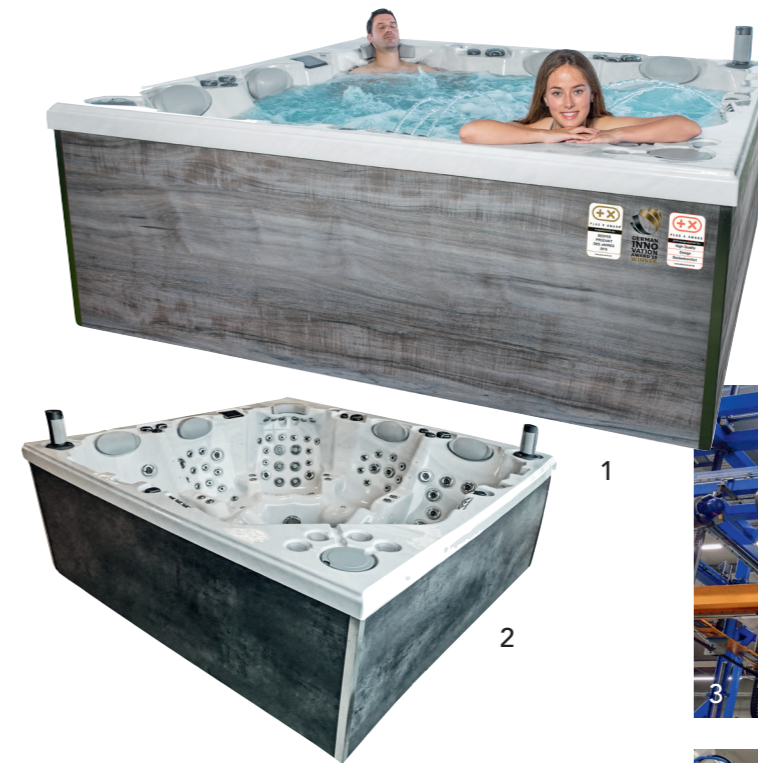
1+2 Mehrfach ausgezeichnet: das Whirlpool-Modell „Champion“ von Whirlcare.

fängt bei einem modernen, anatomisch korrekten Design an und reicht bis zur Verwendung schadstofffreier, langlebiger und energieeffizienter Materialien. AUF EINER GESAMTGRUNDSTÜCKSFLÄCHE VON RUND 50.000 QUADRATMETERN bilden sieben miteinander verbundene Gebäudeteile den Produktionskomplex von Europas größter und modernster Whirlpool- und Swim-Spa-Fertigung.